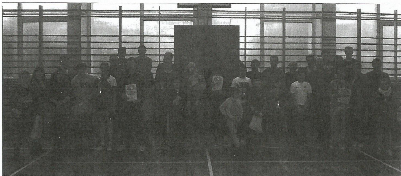
Pamiątkowa fotografia uczestników XIV Rodzinnej Olimpiady Tenisa Stołowego

Po zakończeniu wszyscy uczestnicy zrobili sobie tradycyjnie już pamiątkowe zdjęcie. Każdy uczestnik Olimpiady został nagrodzony. Zwycięzcy otrzymali puchary, pamiątkowe dyplomy oraz nagrody rzeczowe, a pozostali uczestnicy – dyplomy i drobne upominki. XIV Rodzinną Olimpiadę Tenisa Stołowego można zaliczyć do bardzo udanych – taką opinię zgodnie wyrażali wszyscy jej uczestnicy. Podkreślali, że była to dla nich nie tylko okazja do zdrowej rywalizacji sportowej, ale i możliwość spotkania ze znajomymi oraz sposób na aktywny wypoczynek.